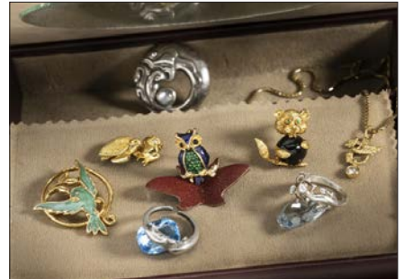
Tierschmuck aus Privatbesitz.

(Tafel 6, Nr. 57 aus unserem Angebot). Darüber hinaus sind Belege für das Auftreten von Bienen, Hühnern, Tauben und Schwänen im antiken Griechenland vorhanden. Sie wurden unter anderem als Schmuckelemente, beispielsweise in Form von Ohrhängern, verwendet. Tauben und Schwäne galten als Symbol von Liebe und Romantik. Hingegen war der Hahn, als Frühaufsteher, bei den alten Griechen das Symbol für den Sonnengott Apollon. Im alten Ägypten waren die Tierdarstellungen sehr eng mit Religion und dem Kult der Pharaonen verbunden. So zierten Geier mit ausgebreiteten Flügeln – ebenso wie Kobras und Falken – Schmuckstücke aus Gold und Edelsteinen. Paviane und Katzen wurden vergöttlicht, und der Skarabäus galt als Symbol für die Seele.