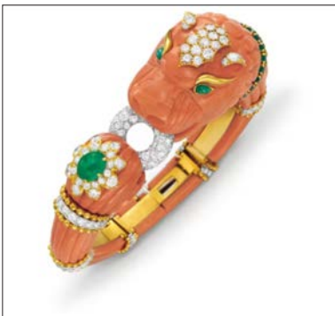
Armreif von Elizabeth Taylor, David Webb.

in die 1950/60er Jahre vermehrt Tierbroschen hergestellt. Diese wurden immer kleiner, leichter und kompakter. Ein Beispiel ist die charmante La-Boutique-Kollektion von Van Cleef & Arpels aus dem Jahr 1954. Diese sollte ein jüngeres Publikum ansprechen und hochwertigen, signierten Schmuck zu einem zugänglicheren Preis anbieten. Besonders populär waren die Tierbroschen, die verspielter, humorvoller gestaltet waren und etwas vermenschlicht wirken, eine Kombination aus Eigenschaften, denen sich selbst modebewusste Damen Hollywoods und der High Society wie Jacky Kennedy oder Grace Kelly nicht entziehen konnten, aus denen in der Folge eifrige Sammlerinnen wurden. Animalischer hingegen waren die Schmuckstücke aus der Hand von Pierino Frascarolo in den 1960er Jahren. Er schuf farbenfrohe Stücke und Sets aus Gold, Edelsteinen und Email und wurde mit seinen der Fauna nachempfundenen Kreationen zu einem der bedeutendsten Juweliere im Bereich animalischer Schmuckstücke. Zur gleichen Zeit trat auch David Webb seinen Streifzug in die Welt des Tierschmucks an. Aus seiner Hand stammen einzigartige, bildhauerische Armreifen, die das Herzstück seiner Kreationen bilden. Elizabeth Taylor konnte sich glücklich schätzen, einige dieser Armbänder besitzen zu dürfen. Eines davon in Form einer Löwin aus Gelbgold, Platin und Koralle, besetzt mit Smaragden und Diamanten, wurde 2011 bei Christie's für 218.500 Dollar verkauft.