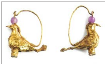
Antike Ohrhänger aus Gold mit Aemisthysthystkugeln (Abbildung: Maurès/Pos-sémé, S. 25).