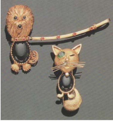
Zwei Broschen, Van Cleef & Arpels (Abbildung Bennet/Nascetti, S. 366).